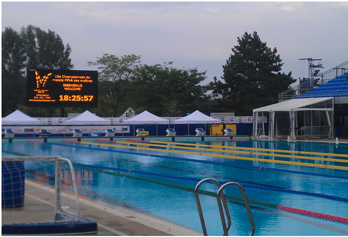
Bassin où ont eu lieu mes deux épreuves