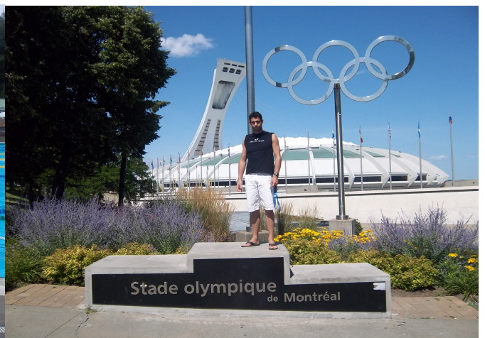
Petite photo devant le stade Olympique