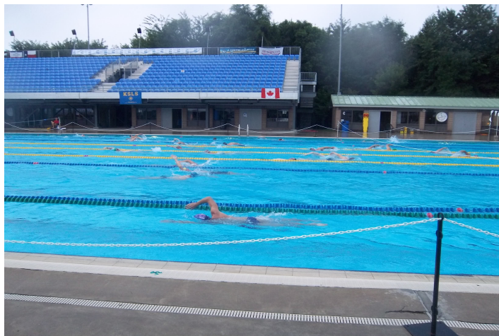
Petit entraînement à 7h du matin dans le bassin de la compétition